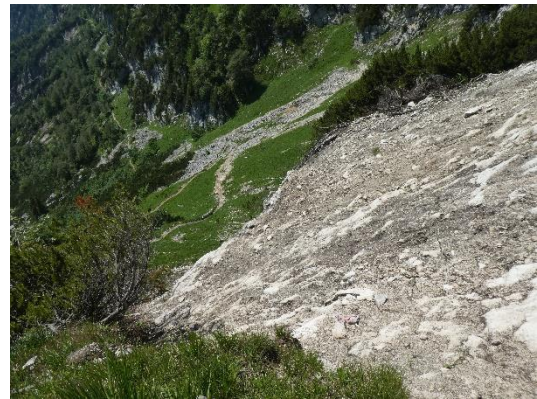
(Hangrutsch am Stöhrweg)

Nach einem langwierigen Genehmigungsprozess, welcher sich über fast 2 Jahre hingezogen hatte, kann die Sektion nun endlich mit den Arbeiten unter Leitung von Wegereferent Wolfgang Feldbauer beginnen. Diese wurden durch einen Hangrutsch in 2019 notwendig, welcher eine komplette Kehre des Weges mit sich gerissen hatte.